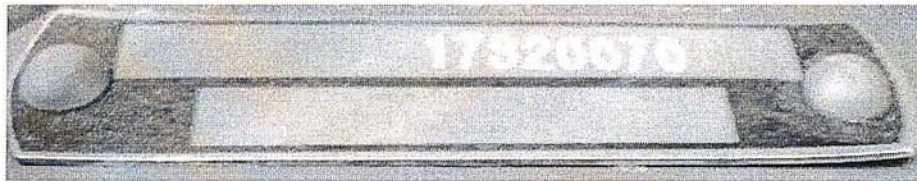
Общий вид и маркировка комбинированного счетчика ВСХНК-50/20