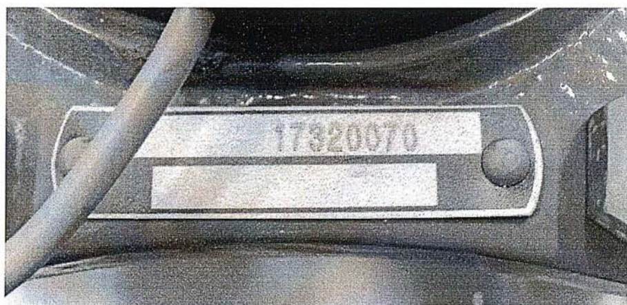
Общий вид и маркировка комбинированного счетчика ВСХНКд-50/20